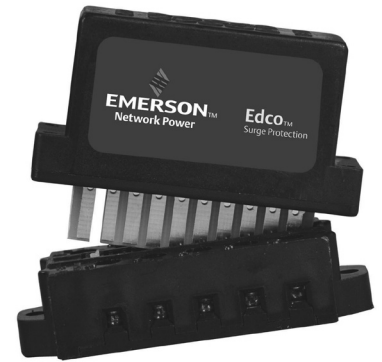
EDCO PCB1B-WKEY BASE SOLD SEPARATELY

The Edco PC642 card edge is gold-plated, double sided and is designed to mate with the Edco PCB1B-WKEY gold-plated female terminal connector (sold separately). When snapped together, the data circuits “pass thru” the protector in a serial fashion from the four “Field Side” terminals to the four “Electronics Side” terminals. Terminals 1 or 10 of the PCB1B must be attached to Building-Approved Ground.