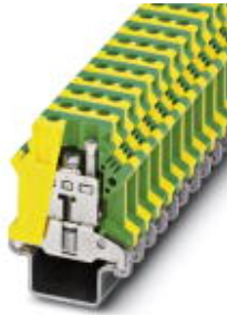
Ground modular terminal block, Connection method: Screw connection, Cross section: 2.5 mm 2 - 25 mm 2 , AWG 12 - 4, Width: 12.2 mm, Color: green-yellow, Mounting type: NS 35/15-2,3

Please be informed that the data shown in this PDF Document is generated from our Online Catalog. Please find the complete data in the user's documentation. Our General Terms of Use for Downloads are valid ( http://download.phoenixcontact.com )