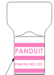
Color coded barrel markings