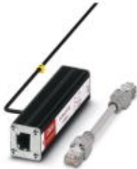
RJ-45 attachment plug with surge protection for LAN interfaces for inserting in the data line, incl. RJ45 cable

Please be informed that the data shown in this PDF Document is generated from our Online Catalog. Please find the complete data in the user's documentation. Our General Terms of Use for Downloads are valid ( http://download.phoenixcontact.com )