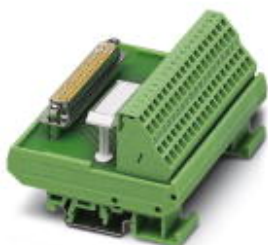
Standard 1:1 D-SUB module, with spring-cage connection and D-SUB pin strip, no. of positions 9

Please be informed that the data shown in this PDF Document is generated from our Online Catalog. Please find the complete data in the user's documentation. Our General Terms of Use for Downloads are valid ( http://phoenixcontact.com/download )