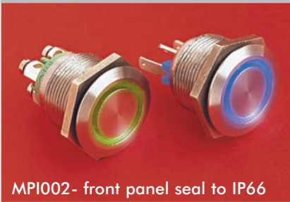
MPI002- front panel seal to IP66