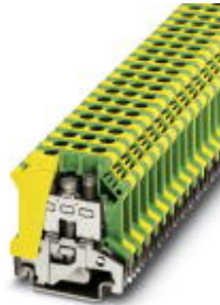
Ground terminal block with screw connection, cross section: 0.5 - 6 mm 2 , AWG: 20 - 8, width: 8.2 mm, color: green-yellow

Please be informed that the data shown in this PDF Document is generated from our Online Catalog. Please find the complete data in the user's documentation. Our General Terms of Use for Downloads are valid ( http://download.phoenixcontact.com )