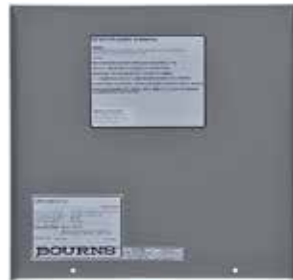
Inside Front Panel