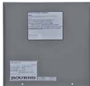
Inside Front Panel