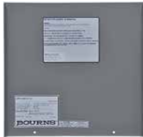
Inside Front Panel