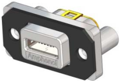
MUSB-K152-30 SERIES MICRO-AB RIGHT ANGLE, PCB TAIL