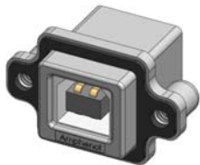
MUSB-D111-30 TYPE B, RIGHT ANGLE