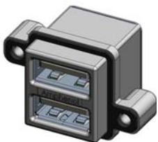
MUSB-C111-30 TYPE A, STACKED, RIGHT ANGLE