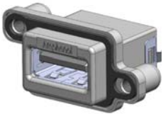
MUSBR-A511-40 TYPE A, VERTICAL, LOW PROFILE