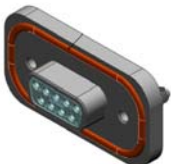
9 POSITION CONNECTOR SHOWN