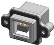
MUSB-D111-30 TYPE B, RIGHT ANGLE