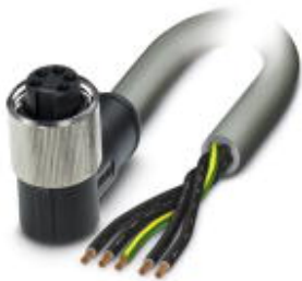
Power cable, 5-pos., gray PVC, 2.5 mm 2 , free cable end to angled 7/8" 16UNF socket, length: 3.0 m

Please be informed that the data shown in this PDF Document is generated from our Online Catalog. Please find the complete data in the user's documentation. Our General Terms of Use for Downloads are valid ( http://download.phoenixcontact.com )