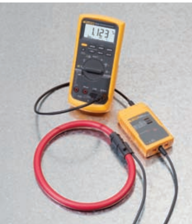
i2000 Flex connected to a Fluke 87V Digital Multimeter.

Fluke. Keeping your world up and running.™