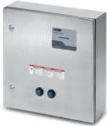
Indoor/outdoor lightning arrester and TVSS system for 120/240 single/split phase

Please be informed that the data shown in this PDF Document is generated from our Online Catalog. Please find the complete data in the user's documentation. Our General Terms of Use for Downloads are valid ( http://phoenixcontact.com/download )