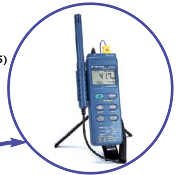
Tripod Mountable (tripod not included)