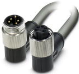
Power cable, 5-pos., gray PUR/PVC, 1.5 mm 2 , angled 7/8" 16UNF male plug to angled 7/8" 16UNF female plug, length: 0.6 m

Please be informed that the data shown in this PDF Document is generated from our Online Catalog. Please find the complete data in the user's documentation. Our General Terms of Use for Downloads are valid ( http://download.phoenixcontact.com )