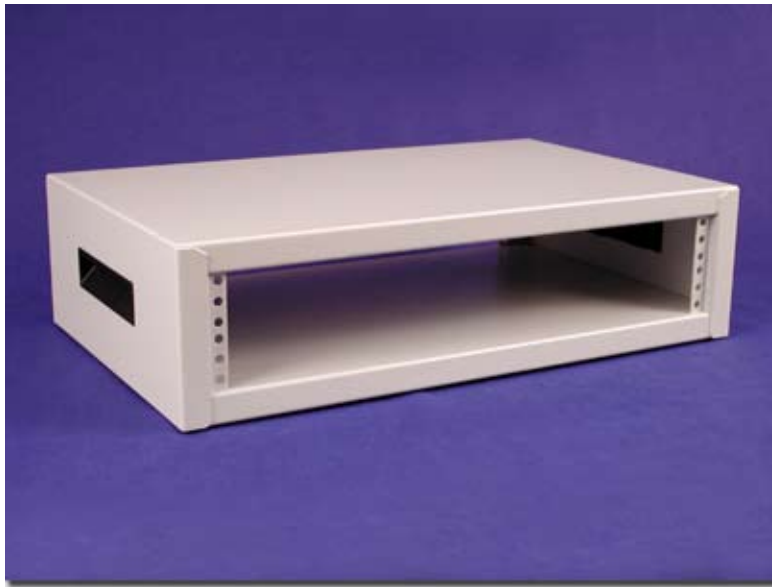
Light Gray (Textured)