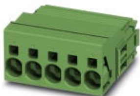
The figure shows a 5-pos. version of the product

PCB connector, nominal current: 41 A, number of positions: 4, pitch: 7.62 mm, connection method: Push-in spring connection, color: green, contact surface: Tin