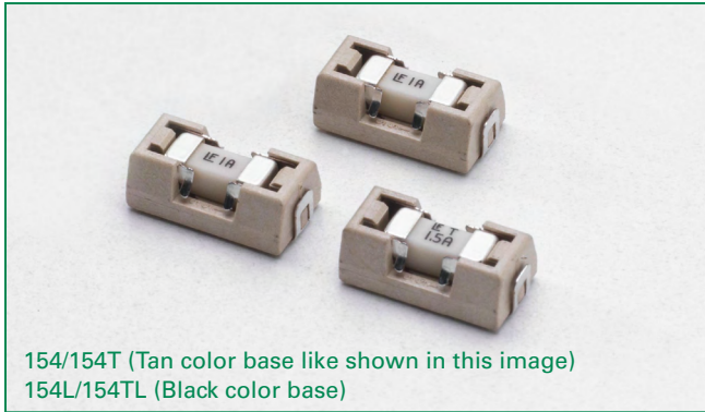
154/154T (Tan color base like shown in this image) 154L/154TL (Black color base)