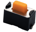
Gull Wing, 320g, Orange Actuator