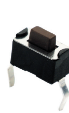
Thru-Hole, 160g, Brown Actuator

Used in applications such as consumer electronics, audio equipment, PCs, VCRs, cable boxes, modems, communications equipment, controls, security and alarm equipment, and test and measurement equipment.