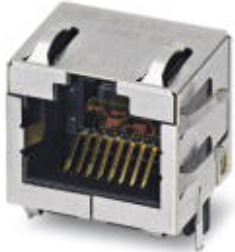
RJ45 socket insert, for PCB assembly, CAT6 A , 8-pos., shielded, with angled solder pins, 1x

Please be informed that the data shown in this PDF Document is generated from our Online Catalog. Please find the complete data in the user's documentation. Our General Terms of Use for Downloads are valid ( http://download.phoenixcontact.com )