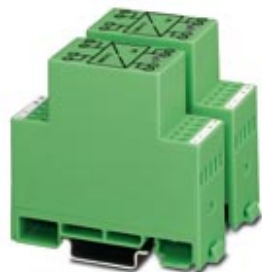
Power supply unit, for passive S0 meter interfaces, input: 230 V AC, output: S0

Please be informed that the data shown in this PDF Document is generated from our Online Catalog. Please find the complete data in the user's documentation. Our General Terms of Use for Downloads are valid ( http://phoenixcontact.com/download )