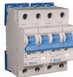
Four Pole Please contact Altech.

Non-standard current ratings available. Minimum quantities may apply. Please contact Altech for further details.