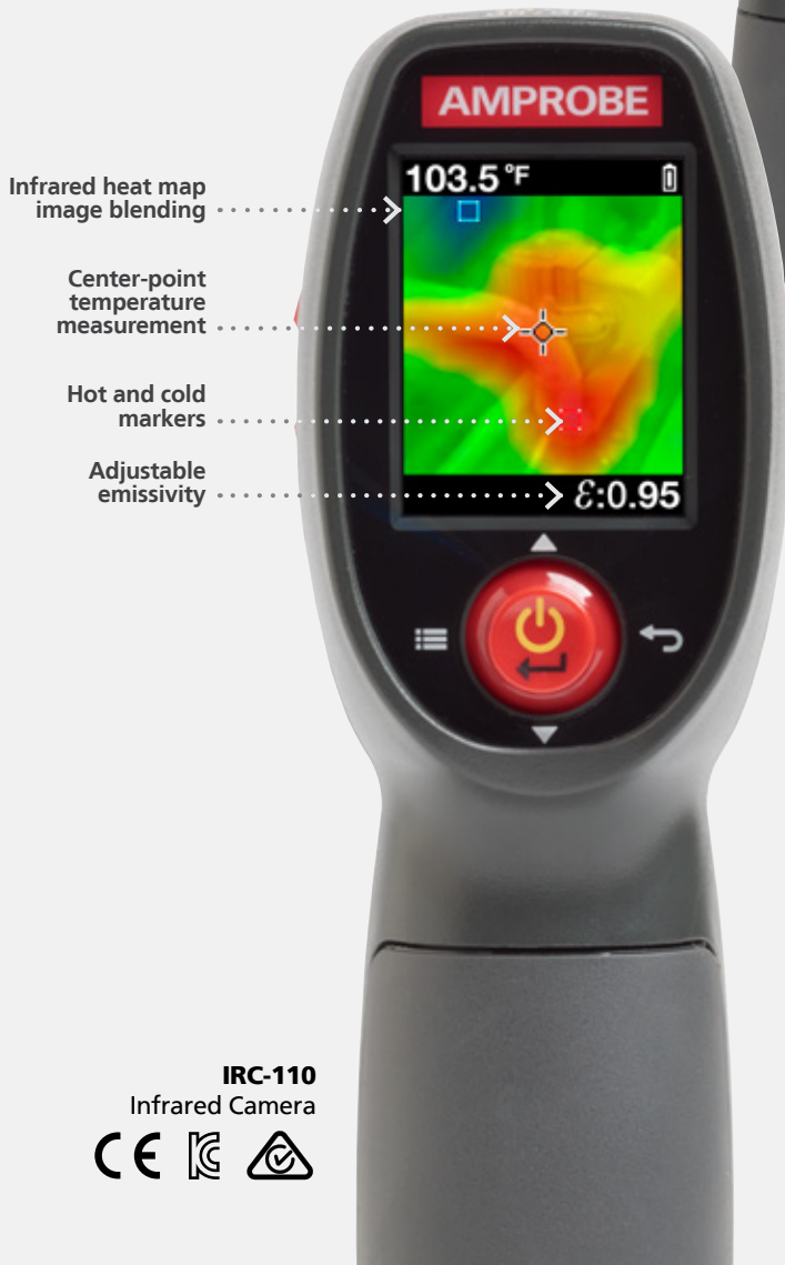
IRC-110 Infrared Camera