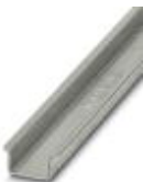
DIN rail, material: Steel, unperforated, 2.3 mm thick, height 15 mm, width 35 mm, length: 2 m

DIN rail - NS 35/15-2,3 UNPERF 2000MM - 1201798