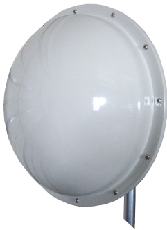
Dish antenna shown with optional radome