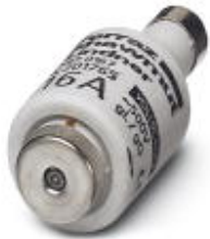
Fuse insert, Nominal current: 16 A, Length: 10 mm, Width: 10 mm, Color: gray

Please be informed that the data shown in this PDF Document is generated from our Online Catalog. Please find the complete data in the user's documentation. Our General Terms of Use for Downloads are valid ( http://download.phoenixcontact.com )