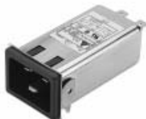
20GENG3E (Optional wire type)