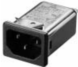
NG3QM (Optional wire type)