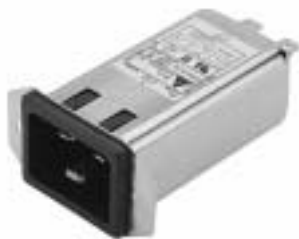
20GEEG3E (Optional wire type)