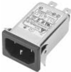
NG3QM(H) (Optional wire type)