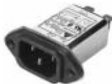
EG3BM EG3QM (optional wire type)