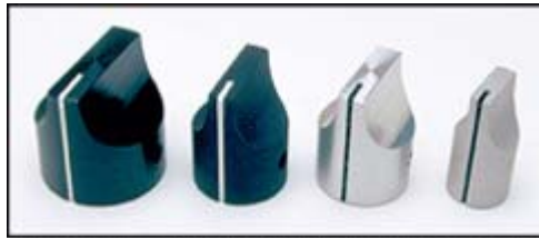
HD90 - Black Gloss, HD75 - Black Matte & Clear Gloss, HD50 - Clear Matte

HD Series: The design of the "HD Series" knob is unmistakably unique. The taller profile of this knob, along with ergonomically designed finger surface, distinguishes its self as a knob that has been specified on 1000's of high-end front panel applications. Partial top and full-length side saw cut indicator line. Two 6-32 set screws.