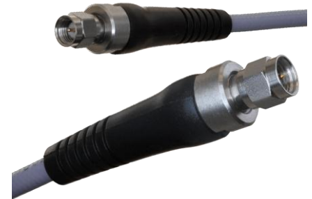
DKT Cable Assembly SMA Male Straight to SMA Male Straight HP190S Cable