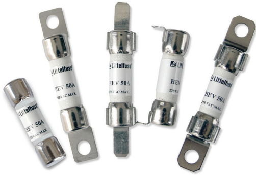
Low Current High Voltage 50A Fuses