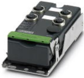
AS-i digital output module, single slave, 4 digital outputs, 24 V DC, IP67 protection

Please be informed that the data shown in this PDF Document is generated from our Online Catalog. Please find the complete data in the user's documentation. Our General Terms of Use for Downloads are valid ( http://phoenixcontact.com/download )