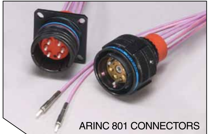
ARINC 801 CONNECTORS