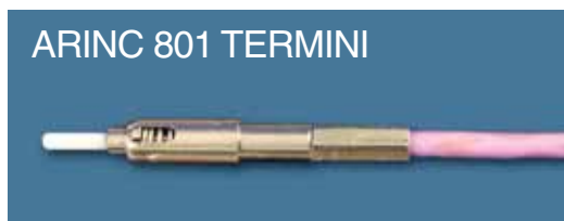
ARINC 801 TERMINI