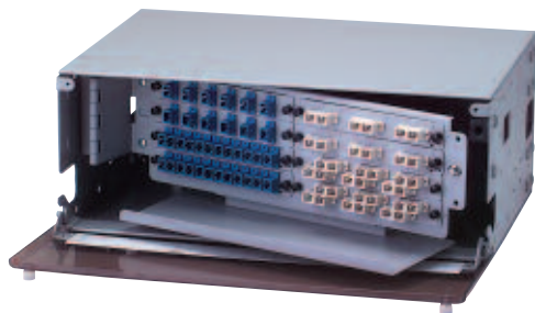
AX100115 FiberExpress (4U) Rack Mount Patch Panel