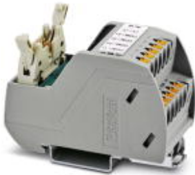
VARIOFACE Professional (VIP) board for the ROC800 controller

Please be informed that the data shown in this PDF Document is generated from our Online Catalog. Please find the complete data in the user's documentation. Our General Terms of Use for Downloads are valid ( http://phoenixcontact.com/download )