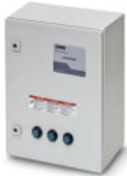
Indoor/outdoor lightning arrester and TVSS system for 277/480 V Wye system

Please be informed that the data shown in this PDF Document is generated from our Online Catalog. Please find the complete data in the user's documentation. Our General Terms of Use for Downloads are valid ( http://phoenixcontact.com/download )