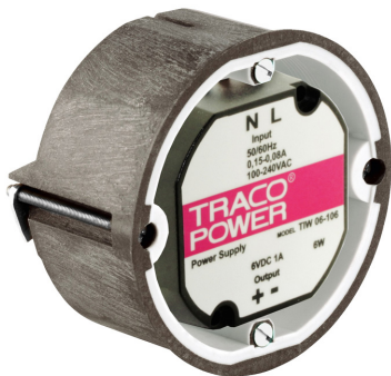
(Mounted in standard flush box)

The TIW series is a new range of small size DC-power supplies which have been designed particularly for applications in home and office installations.