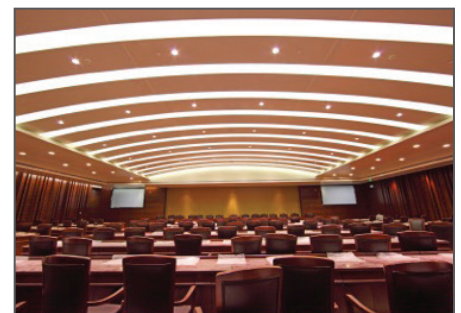
LED panel-lighting applications