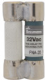
32Vac 20 to 30A