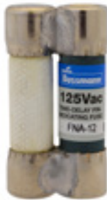
125Vac 12 to 15A