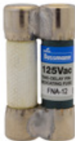
125Vac 12 to 15A