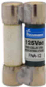
125Vac 12 to 15A