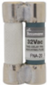
32Vac 20 to 30A