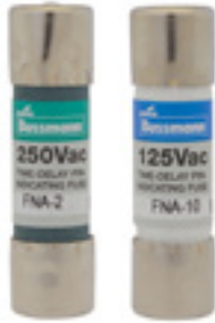
250Vac 1/10 to 6A 125Vac 6-1/4 to 10A