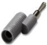
Reducing plug, Color: gray