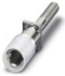
Female test connector, Color: silver

Female test connector - PSBJ 3/13/4 - 0201304