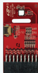
Si7005 UDP DAUGHTER CARD