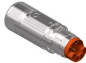
Contact Arrangement mating view

H 52 A 008 NN 00 42 0100 000 H K A 008 N 00 42 0100 000