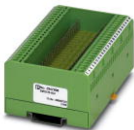
Custom circuit module, consisting of housing, MKDS 3 connection terminal blocks and PCB

Please be informed that the data shown in this PDF Document is generated from our Online Catalog. Please find the complete data in the user's documentation. Our General Terms of Use for Downloads are valid ( http://phoenixcontact.com/download )