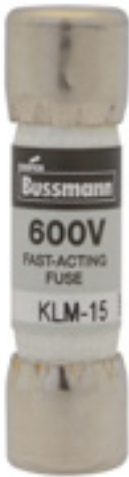
600Vac/dc 1 to 30A