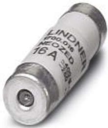
Fuse insert, Nominal current: 16 A, Length: 10 mm, Width: 10 mm, Color: gray

Please be informed that the data shown in this PDF Document is generated from our Online Catalog. Please find the complete data in the user's documentation. Our General Terms of Use for Downloads are valid ( http://download.phoenixcontact.com )