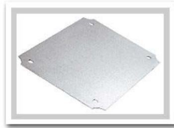
Click on Image for Larger View

Aluminum Internal Panels for AN series boxes. Used to mount customer equipment inside the enclosures. Assembles to mounting bosses on inside of enclosure.